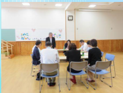
中部圏域3つのハローワークのご担当者と訪問型職場適応援助者(ジョブコーチ)に出席いただきました。

梅雨の晴れ間で陽射がまぶしい6月19日(火)午後、中部圏域内3か所のハローワーク(花巻/北上/遠野)、訪問型職場適応援助者:ジョブコーチ(松風園所属)、当センタースタッフによる『障がい者就業に関わる連絡調整会議』を開催しました。