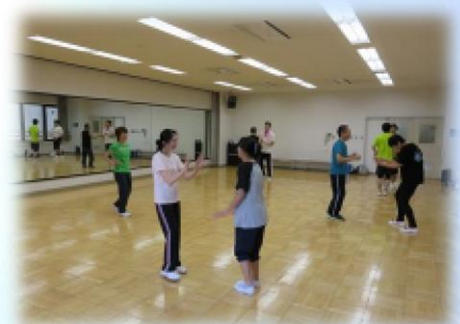
【花巻】 なはんプラザ プレイスタジオ

例年秋から冬に開催しておりました在職者交流研修会を初めて夏期に開催しました。障がいを抱える方が1年間に“軽い運動を含めたスポーツ”を全くしない割合は58.2%にも上っていました(文部科学省調査)。「健康維持」「気分転換」が、スポーツをしている主な目的でもあることから潜在的な要望はまだまだあることを実感しました。今年度は回数を増やし、より多くの就労している方の参加を募ってまいりたいと思います。