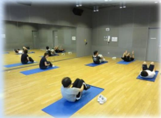
【北上】 さくらホール アクティングループ